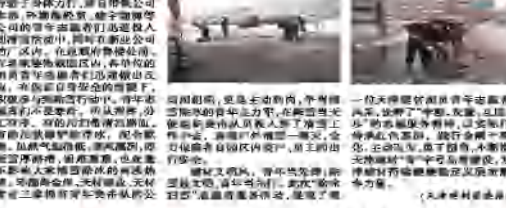
环渤海国际家居公司组织员工开展除冰扫雪志愿服务，保障居民出行安全。

11月27日，降雪天气来临，给市民出行带来了极大不便。环渤海国际家居公司组织员工开展了除冰扫雪志愿服务活动。志愿者们不畏严寒，手持铁锹、扫帚，在小区道路、广场等地辛勤劳作。经过大家的共同努力，积雪和冰块被及时清除，道路恢复了畅通。此次活动不仅方便了居民出行，也展现了公司员工良好的社会责任感。志愿者们纷纷表示，将继续发扬志愿服务精神，为社区建设贡献更多力量。